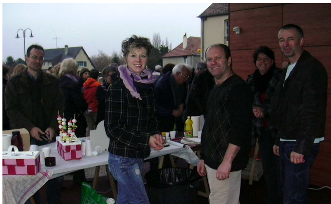
Toute l'après midi, l'association « les Gais Lurons » vous proposait gratuitement boissons chaudes et crêpes.