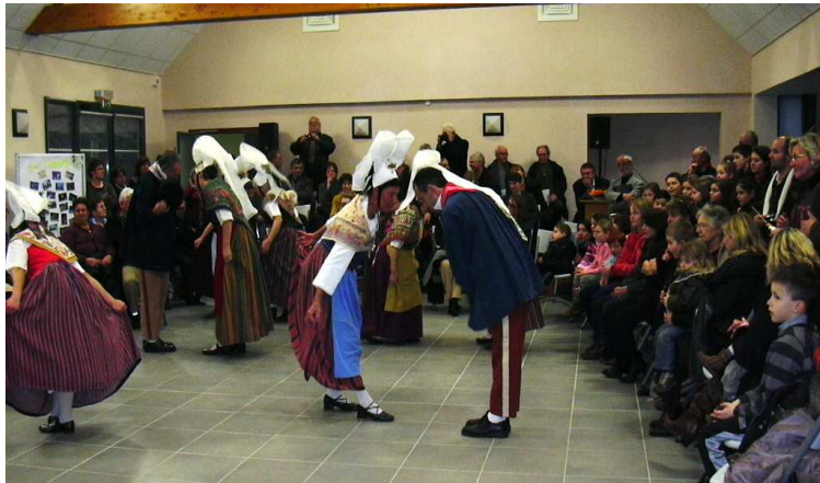
Blaudes et Coëffes en costumes devant un public conquis.

La salle accueillait également une exposition/vente de photos de Michel Lhostis sur Amayé d'hier et d'aujourd'hui (organisée par le Comité des Fêtes) et des panneaux informatifs des différentes associations de la commune en présence de leurs représentants (Anciens Combattants, APE, Gais Lurons, Bibliothèque ICL et Comité des Fêtes).