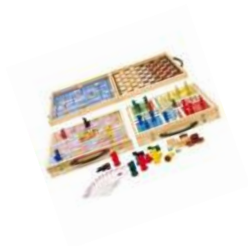
Jeux de société