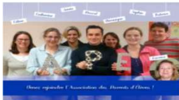
Les membres de l'APE